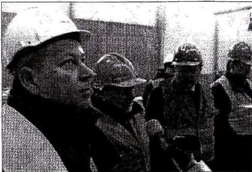
Podczas konferencji 5 lutego wykonawcy opowiadali o dotychczasowych osiągnięciach i planach zakończenia robót

INWESTYCJA | Od wbudowania kamienia węgielnego Zakładu Zagospodarowania Odpadów minęło ponad pół roku. W zaledwie kilka miesięcy powstał m.in. budynek administracyjny, hala segregacji odpadów i kompostownia. Jeśli wszystko pójdzie zgodnie z planem, na początku lipca inwestycja zostanie zakończona.